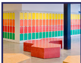
Skab og skabssystemer